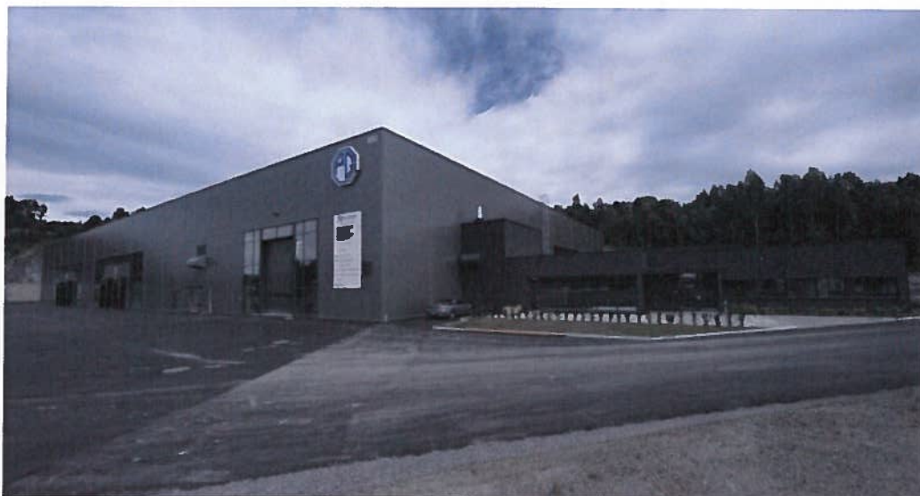
PB Flow Solutions,

Brent spot: $49,16 -0,01 -0,02% USD: 8,38 -0,02 -0,27%