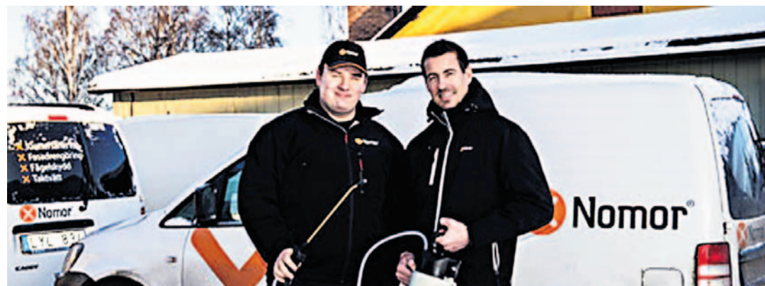
TAR SKADEDYRENE: Det er 19 år siden Nordisk Skadedjursbekjempning ble etablert.